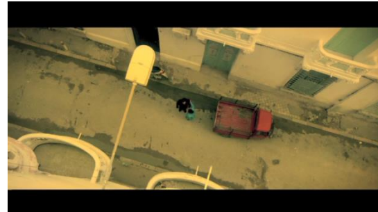
Le voisin, ami de la mère