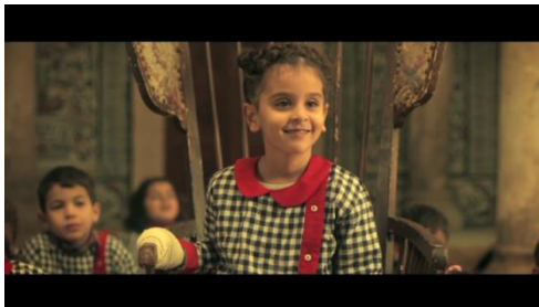
5. La toute puissance