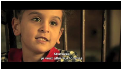
6. La défiance