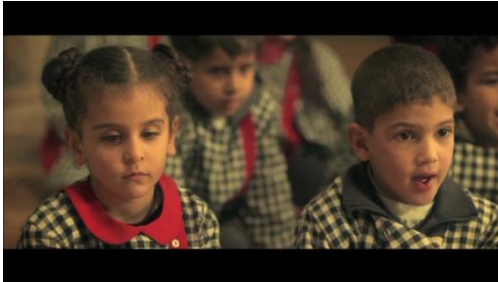
1. La rébellion

Ils peuvent être abordés au travers des postures, des regards, des gestes, des cadrages, des points de vue et des positions dans le cadre