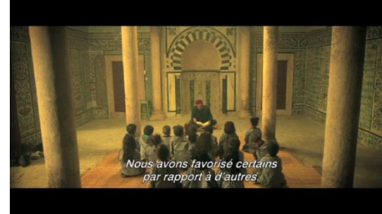
Le maître et les élèves