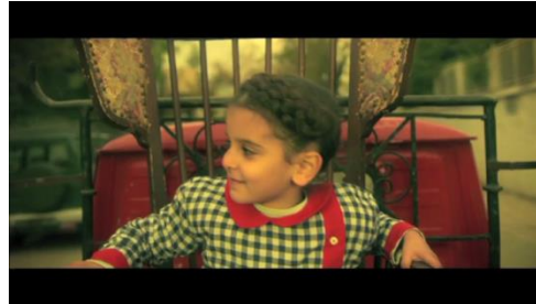
4. La jubilation