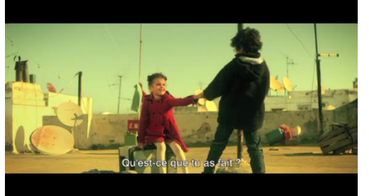
8. Entre amitié et...