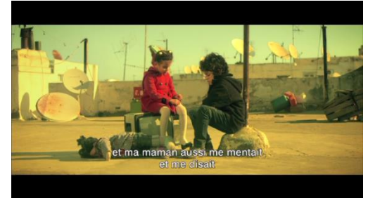
7. La confiance