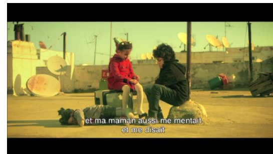
L'ami, le confident d'Amira