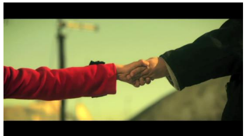
...peau de colle