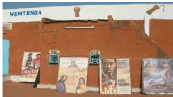
Cinéma Wemtenga, Ouagadougou

Echanges sur les films (échange de notes de visionnement) et sur les questions qui traversent la profession.