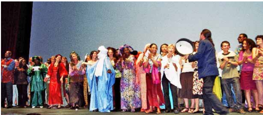
Soirée de clôture, Festival Cinémas d'Afrique 2007