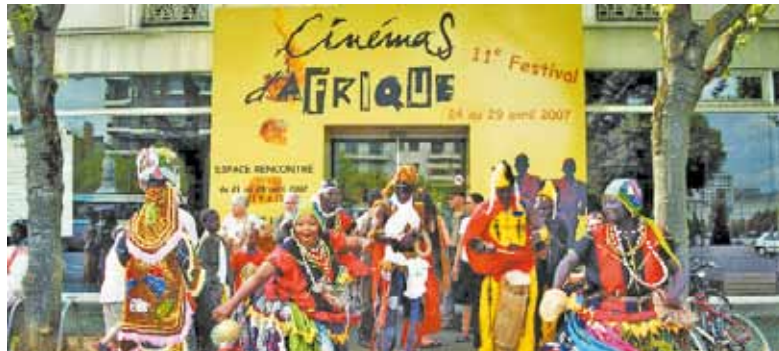
Salle Chemellier, 3 Bd de la Résistance et de la Déportation

Du mercredi au samedi des rencontres sont organisées à 17 h 45 : les réalisateurs échangent avec le public autour des films.